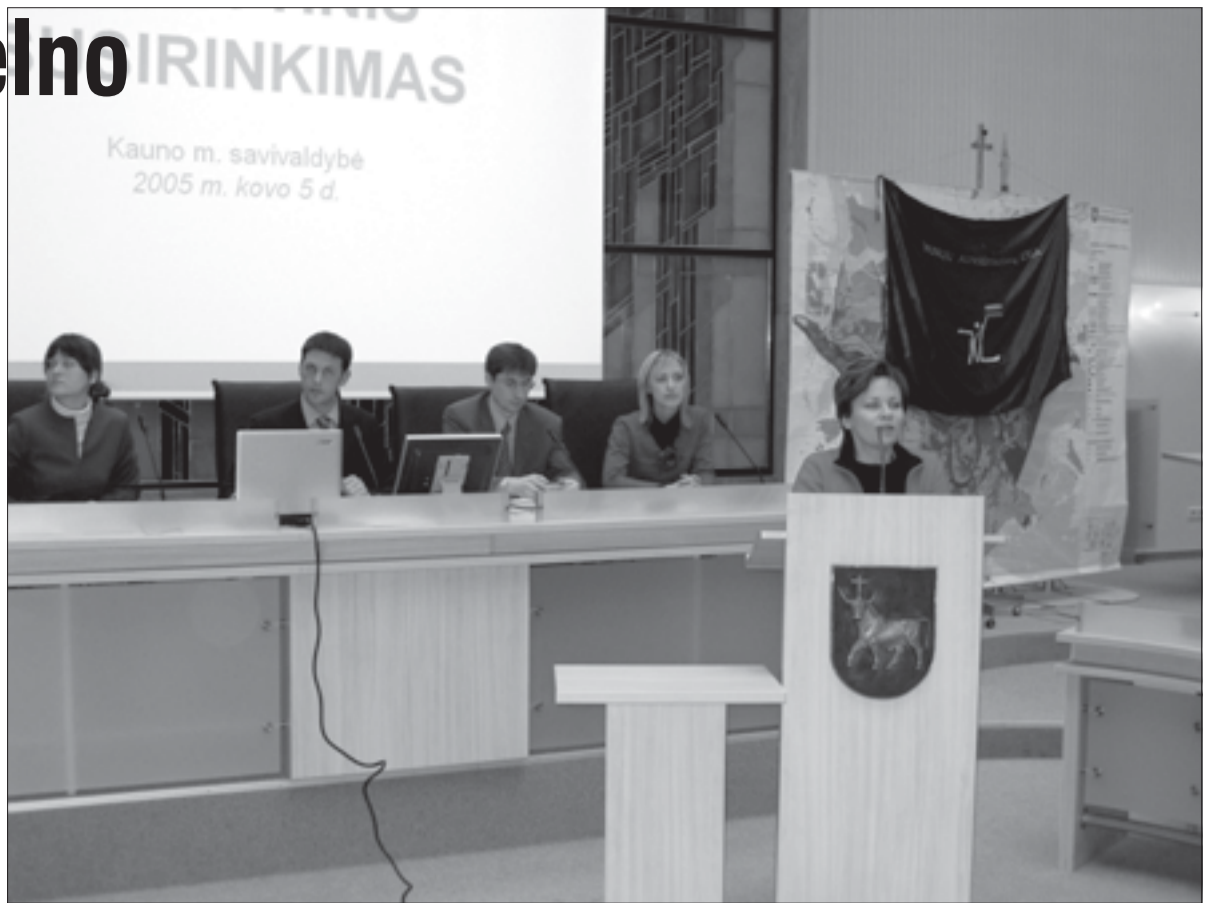
2005-03-05 JKL visuotinis susirinkimas Kaune