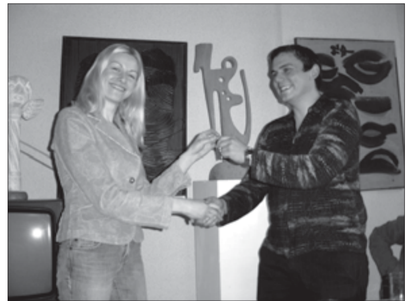
Simbolinis būstinės raktų perdavimas naujam pirmininkui

Rugpjūčio mėn. – Adenauerio fondo vasaros mokykla Palangoje.