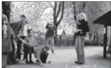
Akcija „Šauniausia šeima“ Kauno zoologijos sode

„Jaunųjų konservatorių lygos Kauno skyrius gegužės 15 d. (sekmadienį) Kauno zoologijos sode surengė šventę – konkursą „Šauniausia šeima“, skirtą Tarptautinei šeimoms dienai paminėti. Akcijos metu vaikučiai galėjo piešti kreidelėmis