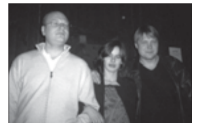
Gimtadienio dalyviai laiko tuščiai neleidžia

Įspūdinga buvo skyriaus ataskaita. JKL Zanavykų skyrius surengė 3 seminarus („Jaunimo NVO veikla rajonuose“, „Projektų valdymas“, „Jaunimo galimybės ES“), kartu su „Apskrituoju stalu“ surengė šventę „Jaunimas EiS“ įstojimo į ES progą, JKL vasaros stovyklą Sudarge, psichologo paskaitą apie egzaminų baimę, dalyvavo „Baltijos kelio“ minėjimo renginiuose, prisidėjo prie Tėvynės sąjungos renginių „Būk labiau lietuvis“ ir „Suk į dešinę“, taip pat TS gelbėjo rinkimų metu, kar-