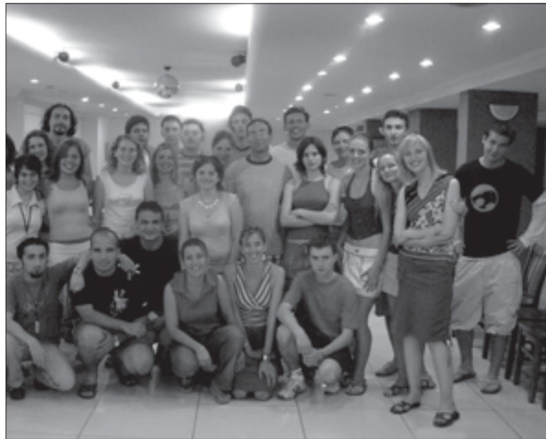
Visi Turkijoje vykusio seminario dalyviai. JKL būrelis dešinėje

„Kiekvieną dieną persekiojo žurnalistai, televizijos reporteriai, o mes su pasididžiavimu pristatinėjome savo šalį ir organizaciją“