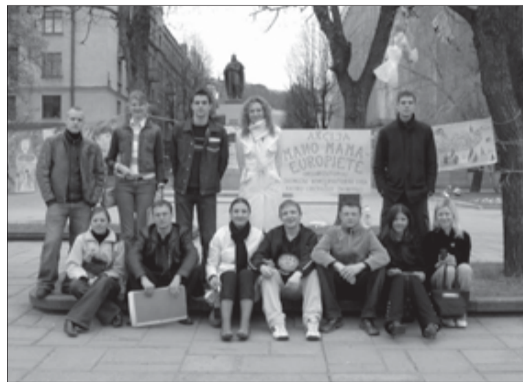
Renginys vyko prie Kauno savivaldybės gegužės 1 d.

Renginys skirtas įstojimo į ES metinėms ir Motinos dienai