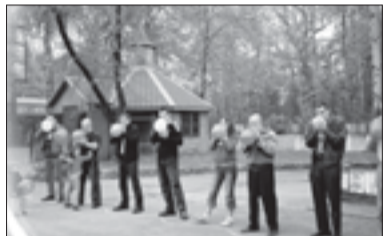
Balionų pūtimo čempionatas

ant grindinio. Visi mažieji menininkai buvo vaišinami saldainiais. Apžiūrėję Zoologijos sodo gyventojus, lankytojai galėjo sudalyvauti šauniausios šeimos konkurse. Tokiam