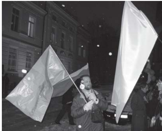
Prie jaunimo iniciatyva surengtos akcijos prisidėjo ir vienas kitas praeivis

spalva) piketuojantis jaunimas susilaukė deramo spaudos dėmesio. JKL nariai dosniai dalijo interviu žurnalistams ir pasakojo dėl ko susirinkę. JKL vardas dar kartą nuskambėjo per visą Lietuvą, o gal ir dar plačiau. Prie jaunimo iniciatyva surengtos akcijos prisidėjo ir vienas kitas praeivis. Gatvėje, prie ambasados, jaunimas padėjo ilgą eilę apelsinų ir mandarinų bei uždegė žvakučių. Taip išreiškė supratimą, koks svarbus pasaulinės visuomenės palaikymas tokiais atvejais. Juolab, kad dar visai neseniai mums visiems teko išgyventi panašius įvykius čia pat – Lietuvoje. Būtent dėl to ši jaunimo akcija tapo ypač svarbi parama smaugiamai Ukrainos demokratijai.