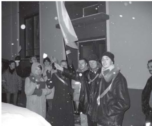
Neapsikentę dėl Seimo daugumos neryžtingumo pasmerkti balsavimo įstatymų pažeidimus, jaunimas nusprendė išreikšti savo pilietinį palaikymą demokratijos jėgoms Ukrainoje