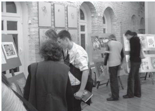
Mokinių darbai buvo eksponuojami „Tolerancijos centre“

minima nuo 1995-ųjų UNESCO iniciatyva. Šią dieną skatinama atkreipti visuomenės dėmesį į skirtingų nuomonių, tautybių, etninių ar socialinių grupių toleranciją. Įvairiose šalyse organizuojami renginiai, skirti ugdyti toleranciją, pakantumą, gebėjimą suprasti kitus.